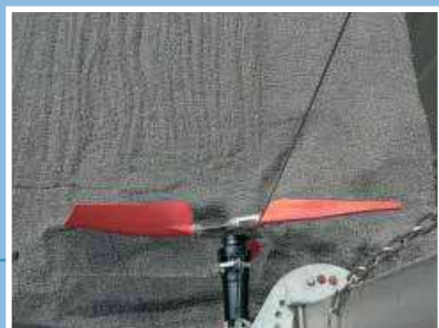
Acceleratore di flusso Flowmaker