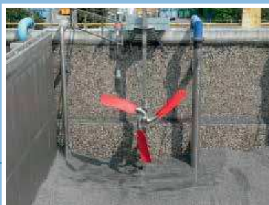
Acceleratore di flusso Flowmaker