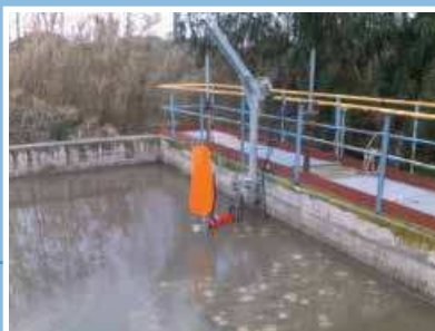
Acceleratore di flusso Flowmaker