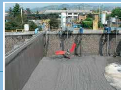
Acceleratore di flusso Flowmaker